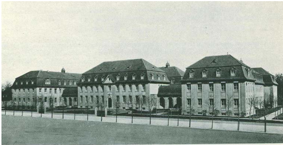
Abb. 1. Aus der Gruppe „Gesundheitsfürsorge“: das Kaiserin Auguste Victoria Haus, Berlin-Charlottenburg.

Ich begrüße Sie alle sehr herzlich und freue mich, dass Sie zum hundertsten Geburtstag des Kaiserin Auguste Viktoriahauses (KAVH) ein Interesse daran haben, etwas über die Initiatorin dieses Hauses zu erfahren.