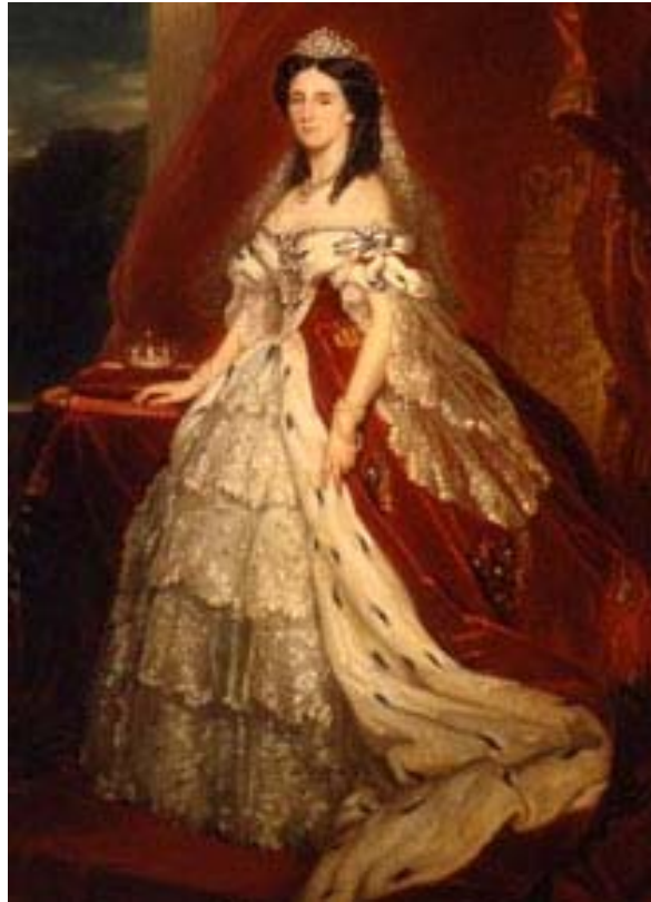
Kaiserin Augusta; Porträt von Franz Xaver Winterhalter

Kaiserin Augusta war die zweite Tochter des Großherzogs Carl Friedrich und der Großfürstin Maria Pawlowna Romanowa, einer Schwester von Alexander I. und Nikolaus I und Enkelin Katherina der Großen.