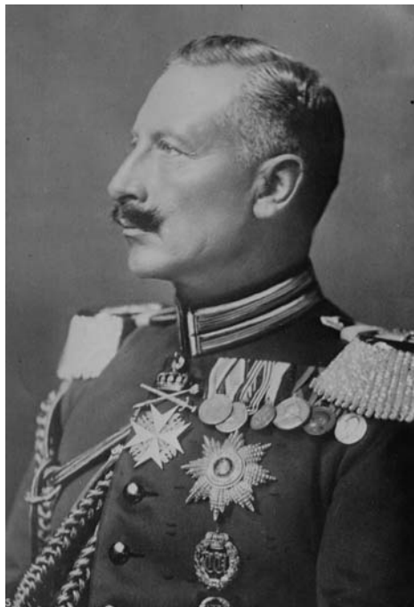
Kaiser Wilhelm II

Es ist nicht leicht für mich, aus den vielen vorhandenen Schilderungen und Berichten, ein zutreffendes Bild des Kaisers zu erarbeiten, ohne den Rahmen dieses Vortrags zu sprengen. Daher beschränke ich mich darauf, den Kaiser nur am Rande zu erwähnen, wo das nötig ist. Obwohl klar ist, dass das Erscheinungsbild von Kaiserin Auguste Viktoria natürlich durch ihn stark beeinflusst wurde.