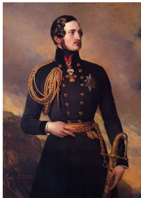
Beide Porträts von Franz Xaver Winterhalter